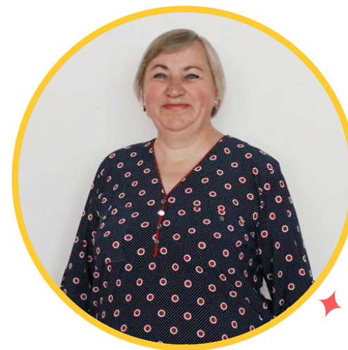
AŠ REGINA, MAN PATINKA AUGINTI GĖLES.