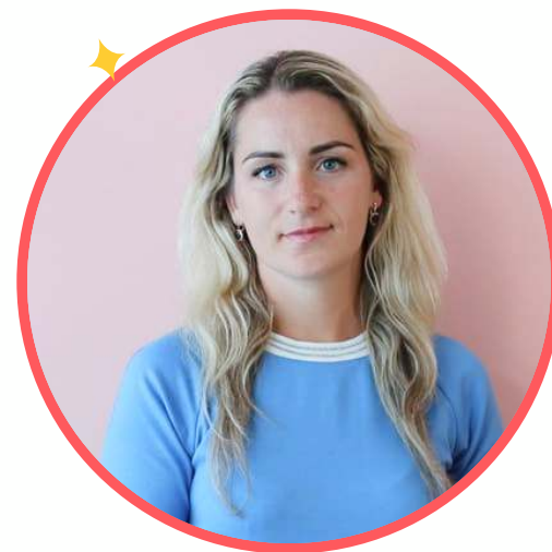
AŠ RITA, MĖGSTU VAŽINĖTI DVIRAČIU.