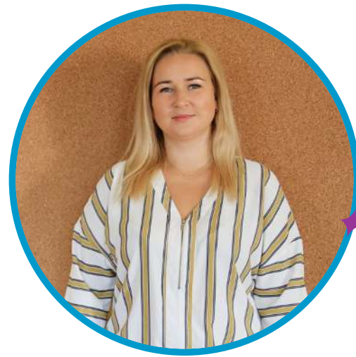
AŠ DONATA, MAN PATINKA KLAUSYTIS MUZIKOS.