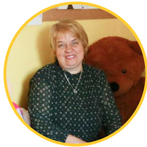
AŠ DAIVA, MĖGSTU LAIKĄ LEISTI GAMTOJE.